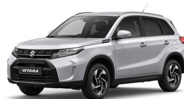
Silky Silver Metallic