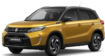
Solar Yellow / Cosmic Black