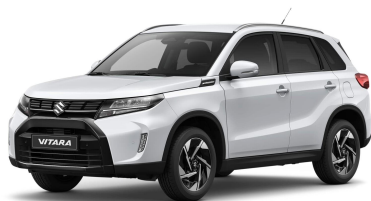
Cool White Metallic