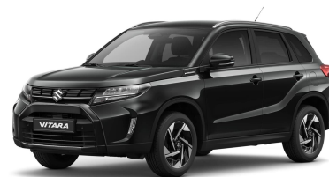
Cosmic Black Metallic