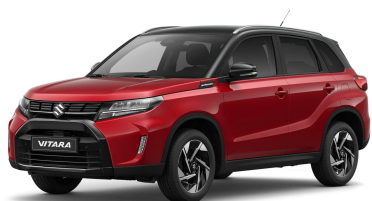
Bright Red / Cosmic Black