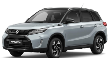
Ice-Grayish Blue / Cosmic Black