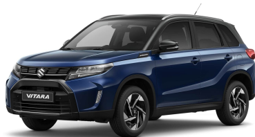
Sphere Blue Pearl / Cosmic Black