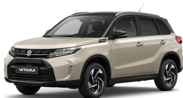
Savanna Ivory / Cosmic Black