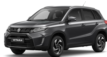
Titan Dark Gray